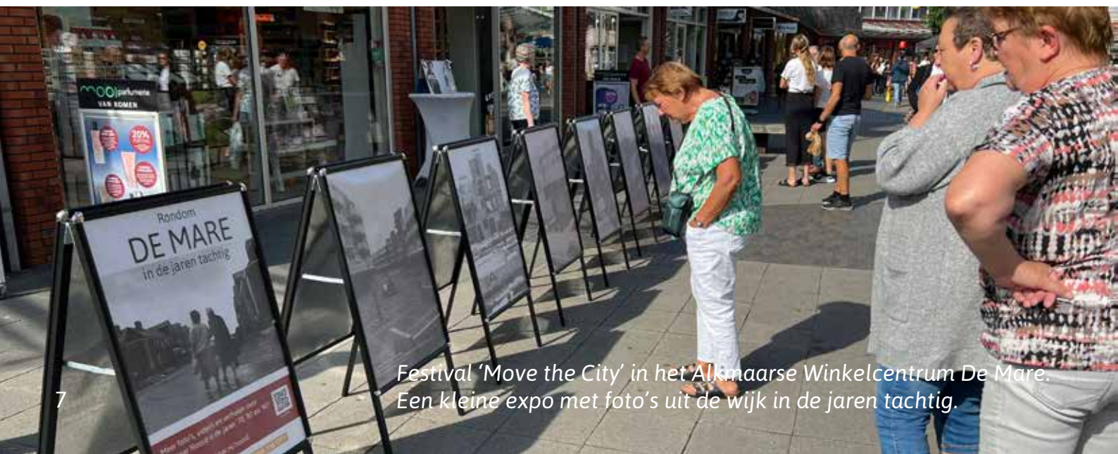
Festival 'Move the City' in het Alkmaarse Winkelcentrum De Mare. Een kleine expo met foto's uit de wijk in de jaren tachtig.