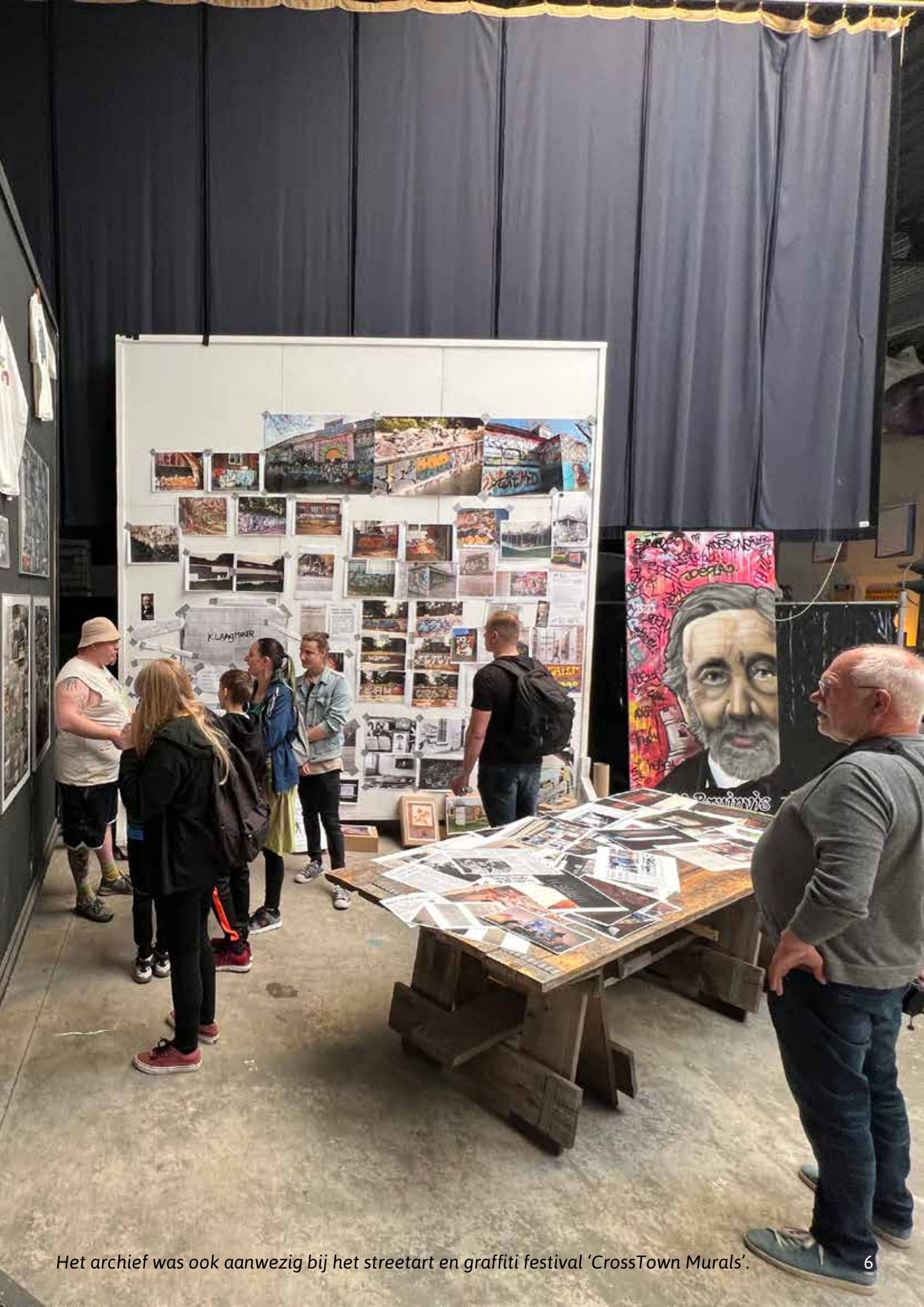
Het archief was ook aanwezig bij het streetart en graffiti festival 'CrossTown Murals'.