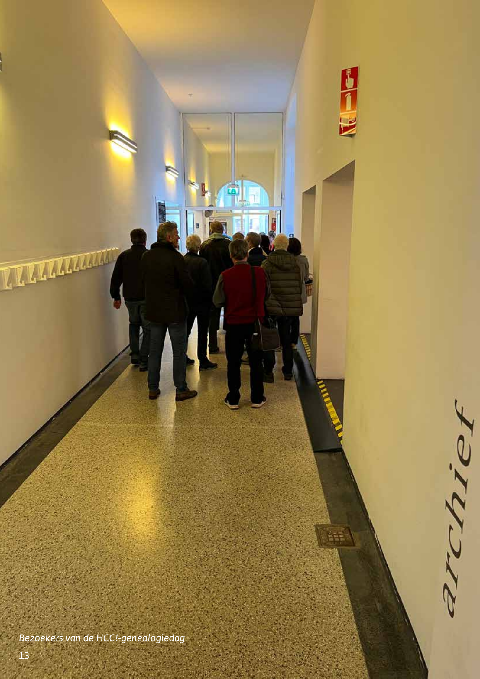
Bezoekers van de HCC!-genealogiedag.