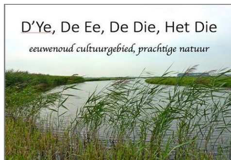
De Die (Historische Vereniging Heiloo)

De Historische Vereniging Heiloo nodigt de Vrienden uit voor een bezoek aan dit Museumkwartier van Heiloo. Deelnemers aan de excursie bezoeken het Historisch Museum waar een presentatie wordt gegeven over de huidige tentoonstelling over het stroomgebied van het veenriviertje De Die. Ook een bezoek aan het Archeologisch Museum Baduhenna, de VVV-Verhalenkamer en een korte rondleiding door de Cultuurkoepel staan op het programma. Alle programmaonderdelen bevinden zich op het Landgoed Willibrordus (Kennemerstraatweg 464, Heiloo).