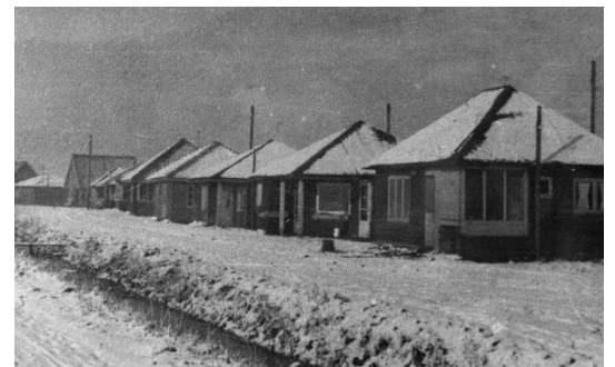
Hollywood (Historische Vereniging Callantsoog)

De Historische Vereniging Callantsoog werkt aan een boek en een tentoonstelling over dit unieke dorpje. De Stichting Vrienden van het Archief heeft financieel bijgedragen aan het boek. Als dank daarvoor bent u uitgenodigd om in het Dorpshuis Kolfweid (Jewelweg 7, Callantsoog) een lezing over Hollywood bij te wonen. Na de lezing volgt een korte rondleiding door de tentoonstelling in Museumboerderij Tante Jaantje (Dorpsplein 33, Callantsoog).