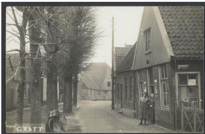
De Dorpsstraat in Graft, tussen 'de witte brug' en 'de hoek van Graft', circa 1927.