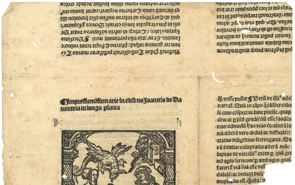
Een van de fragmenten, afgesneden van een drukvel met vier pagina's. Met de vermelding van de drukker en een deel van de houtsnede.