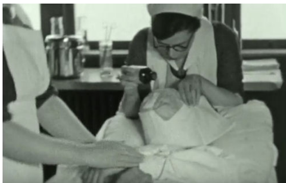
indruppelen van het narcosemiddel