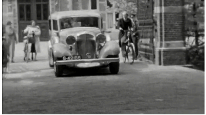
Verpleegster met linnengoed stapt in en ziekenauto rijdt de poort uit op weg naar de patiënt