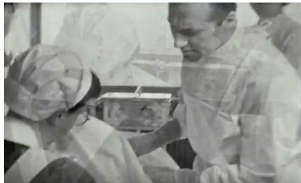
tijdens de operatie