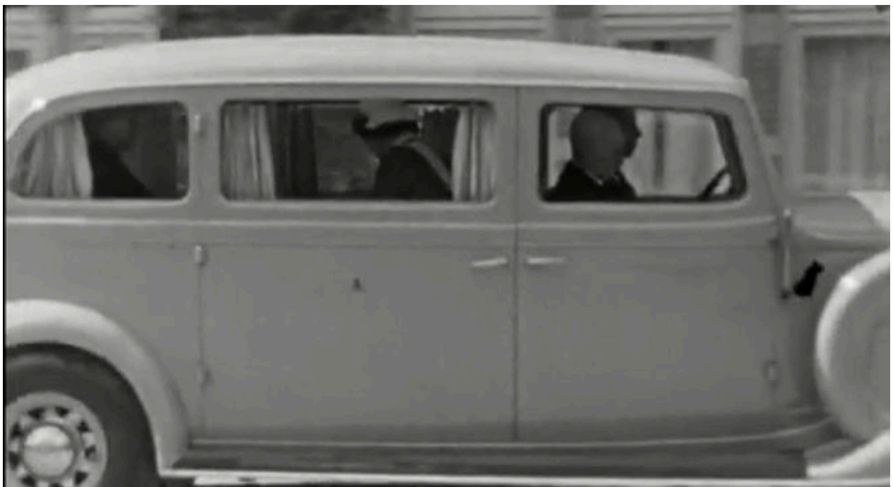
... en komt terug bij het ziekenhuis met patiënt, ouders en verpleegster!

Zo moet het destijds dus ook met mij zijn gegaan. Heerlijke beelden om nu 78 jaar later alsnog aan mijn herinneringen te kunnen toevoegen via: